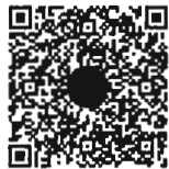
หนังสือนัดประชุม และระเบียบวาระการประชุม ร่วมกันของรัฐสภา

หมายเหตุ เอกสารประกอบการประชุมร่วมกันของรัฐสภา ได้เผยแพร่ทางสื่ออิเล็กทรอนิกส์ ตามข้อบังคับ การประชุมรัฐสภา พ.ศ. ๒๕๖๓ ข้อ ๑๓ โดยท่านสมาชิกฯ สามารถอ่านเอกสารประกอบการประชุมได้ โดยการสแกน QR code ที่ปรากฏอยู่ในหนังสือนัดประชุม หรือทาง www.parliament.go.th